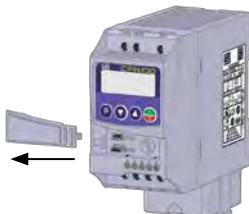
а) Снятие передней крышки и модуль